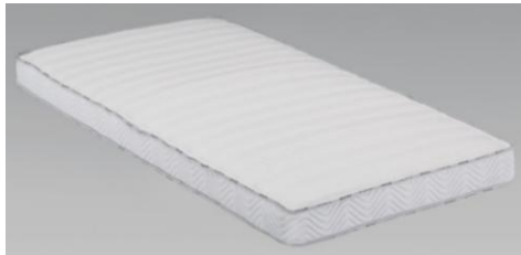
ホワイト色 (S)サイズ