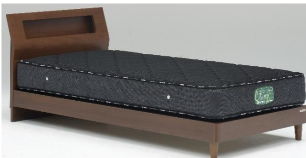
Sキャビ引出しなし BR(ブラウン)(S)サイズ