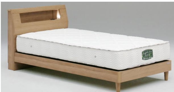
Lキャビ引出しなし NA(ナチュラル)(S)サイズ