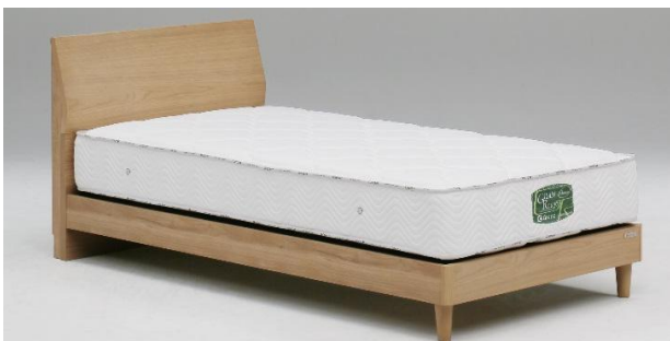
フラット引出しなし NA(ナチュラル)(S)サイズ