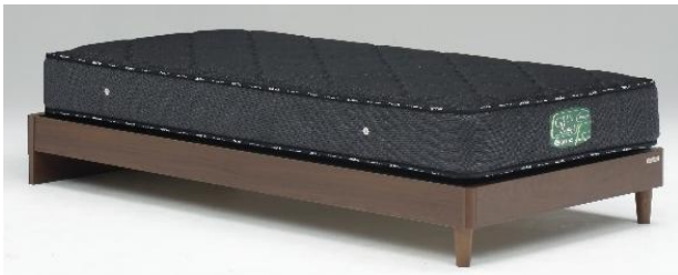
ヘッドレス引出しなし BR(ブラウン)(S)サイズ