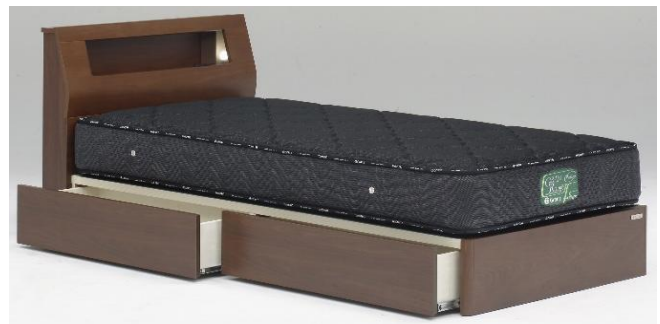
Lキャビ引出し付き BR(ブラウン)(S)サイズ