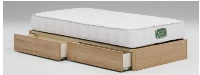
ヘッドレス引出し付き NA(ナチュラル)(S)サイズ