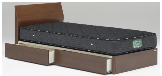
フラット引出し付き BR(ブラウン)(S)サイズ