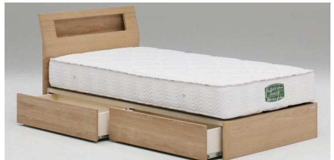
Sキャビ引出し付き NA(ナチュラル)(S)サイズ